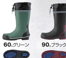
60.グリーン 90.ブラック