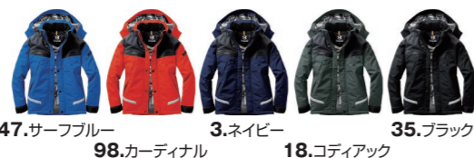
47.サーフブルー 98.カーディナル 3.ネイビー 18.コディアック 35.ブラック

防水性、撥水性、浸透性、保温性などアウトドアフィールドでも役立つ様々な機能を備えた防水シームテープ仕様のマウンテンパーカ。身頃の前後、袖に反射材を装着する事で、夜の視認性を強調し、同時にタウンユースへの順応性も高めました。