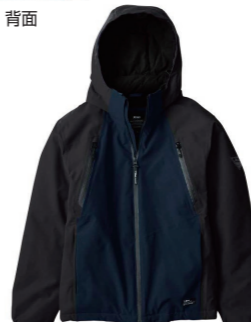
19.ディーブネイビー