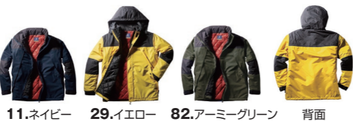
11.ネイビー 29.イエロー 82.アーミーグリーン 背面

しっかり防水、しかもムレにくい。グラフェン再生中綿と裏地のブラックアルミプリントが優れた保温性を発揮。防水性を高めるシームテープ加工を採用し、防水防寒を追求したユニフォームです。