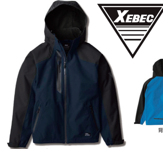
19.ディーブネイビー